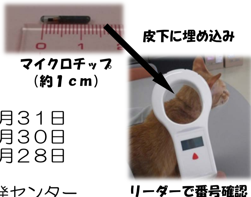
マイクロチップ （約1cm）

裏面の記入例を参照のうえ，福岡市家庭動物啓発センター（ふくおかどうぶつ相談室）まで，官製はがきでお申し込みください。