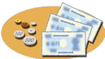
< 参考 > 1年間にかけた費用 (一頭あたり)

ペットを飼い続けるためには、フードや日用品、治療費などでお金がかかります。飼い始めてから経済的な理由で行き詰らないように、あらかじめ必要な費用を考えておきましょう。