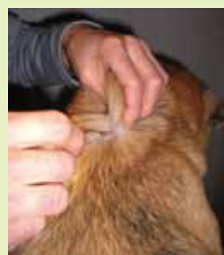
マイクロチップの埋め込み