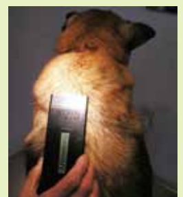
マイクロチップの読み取り